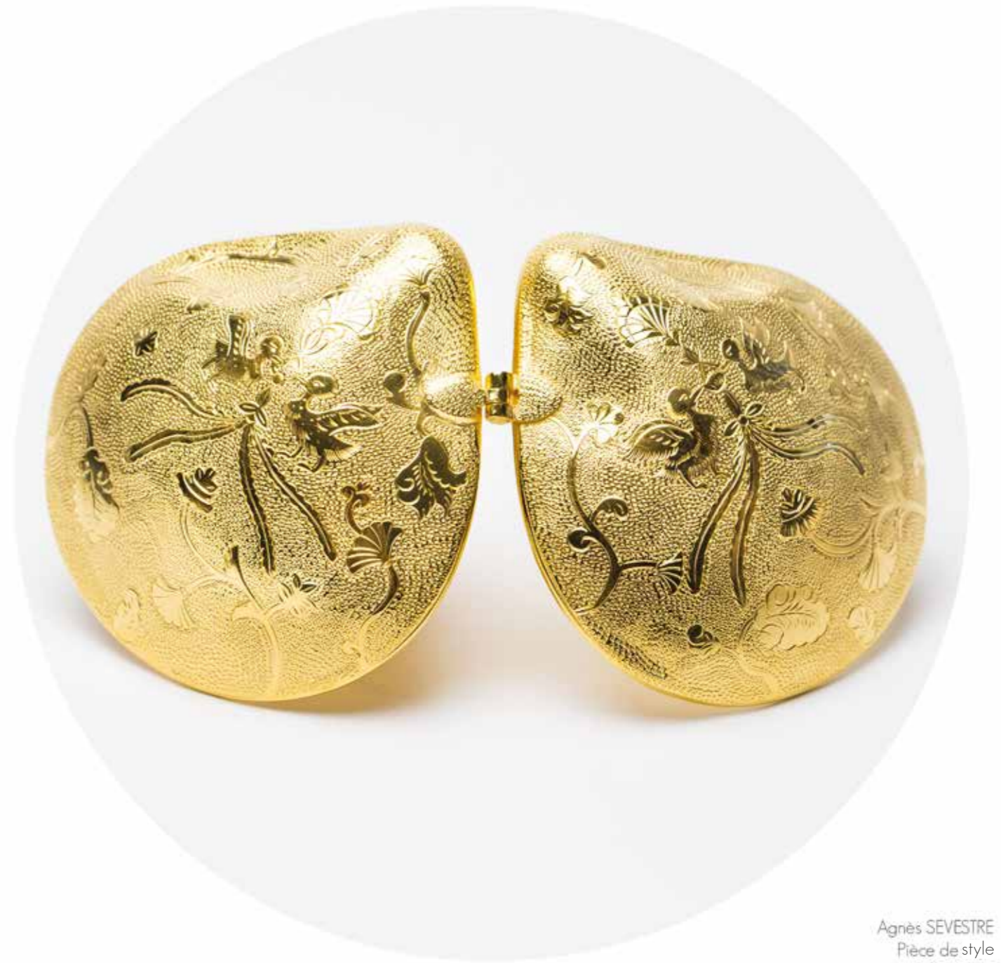
Agnès SEVESTRE Pièce de style Boîte de la dynastie Tang