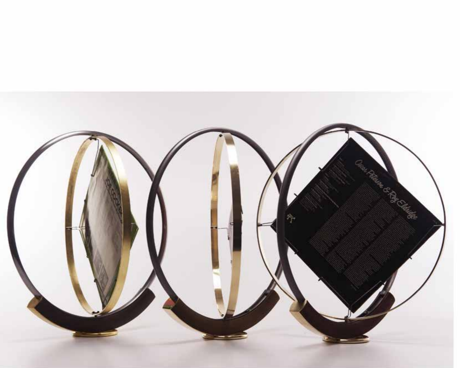
Nikodème MAHEUX Cercle Vinyle