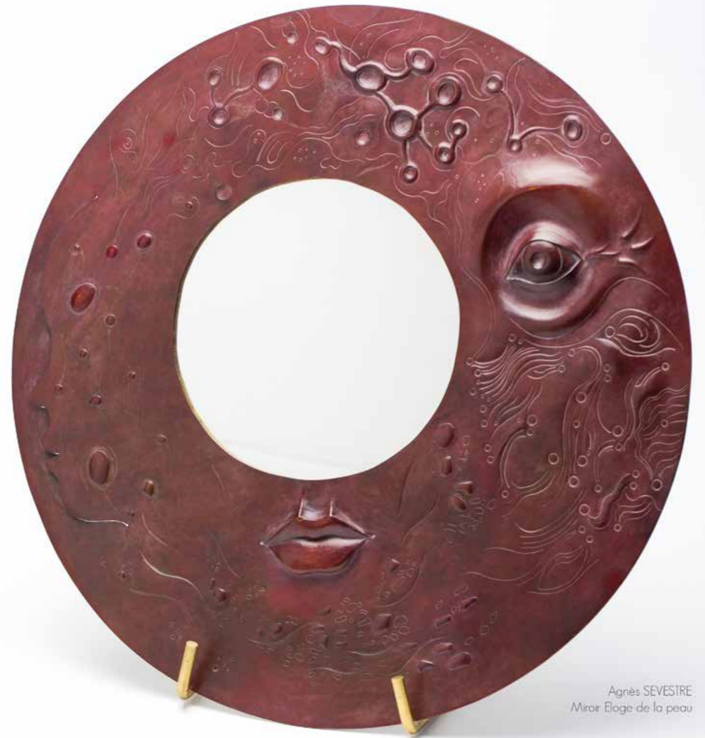
Agnès SEVESTRE Miroir Eloge de la peau